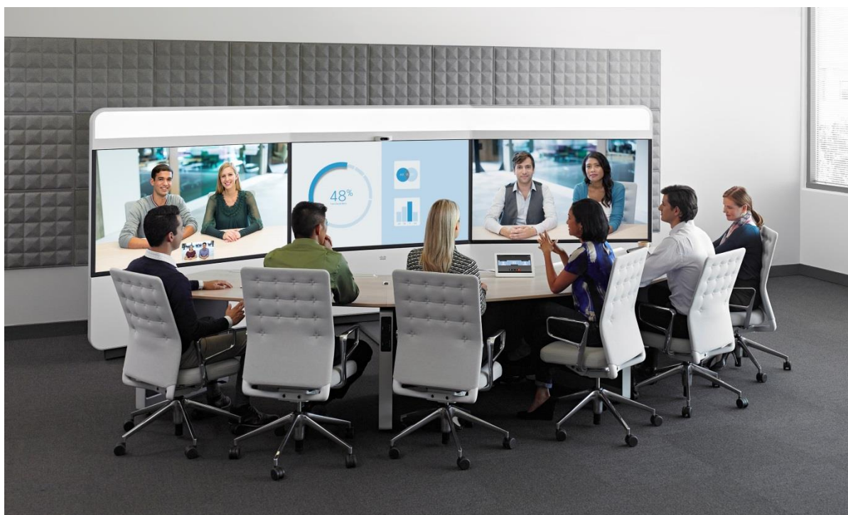
图1. 思科网真IX5000，6位与会者

这套造型优美且功能强大的系统采用了业界首创的3×4K超高清(Ultra High Definition - UHD)镜头集群，3×70英寸高清LCD显示屏以及剧场级音响系统，思科IX5000系列网真将人们置身于如同身处桌子对面的沉浸式协作体验。IX5000系列包括单排会议桌支持6位与会者的IX5000，以及双排会议桌支持18位与会者的IX5200两种型号。