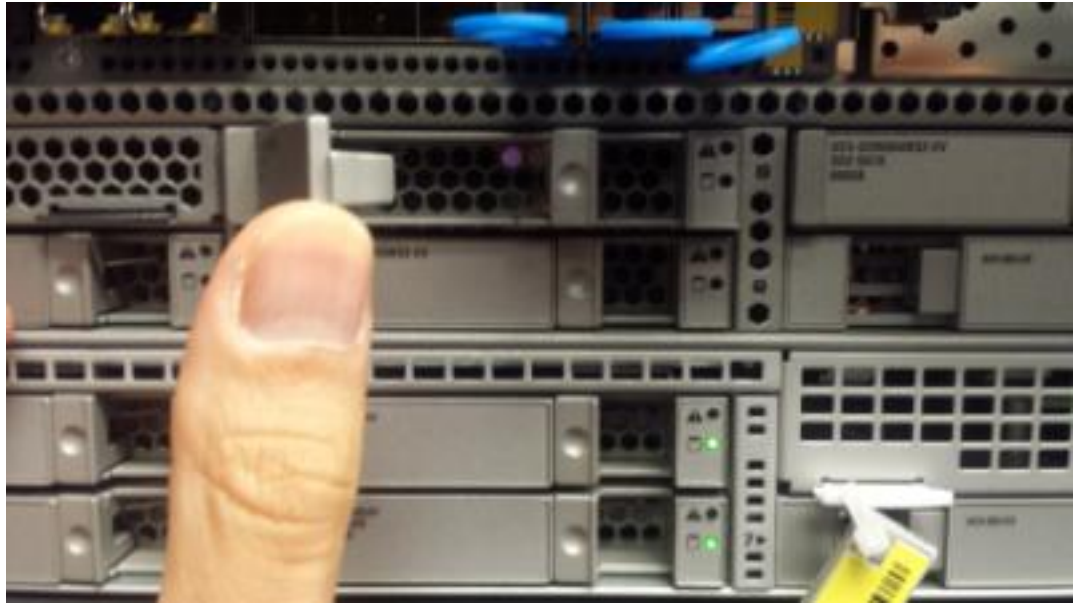
الخطوة الثالثة: قم بتشغيل الجهاز.