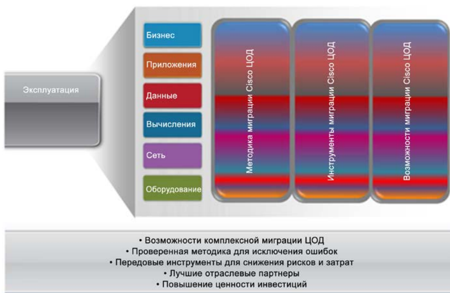
Рис. 2. Методики Cisco для миграции ЦОД

Такой подход позволяет выявить связанные с миграцией риски и устранить их на ранних этапах жизненного цикла проекта. Полагаясь на услуги Cisco, вы гарантируете успех проектов миграции ЦОД любого размера, независимо от сложности и масштабности перемен. Комплексный подход позволяет значительно сократить сроки реализации проекта и предлагает надежный путь к его своевременному завершению. Благодаря услугам Cisco по миграции ЦОД даже для крупномасштабных проектов миграции можно уменьшить риски, сократить время реализации и повысить рентабельность инвестиций.