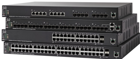
Figure 1. Commutateurs administrables et empilables Cisco 550X

Les commutateurs Cisco 550X sont conçus pour protéger vos investissements technologiques alors que votre entreprise se développe. Contrairement aux commutateurs soi-disant empilables, mais dont certains éléments requièrent une administration et un dépannage distincts, les commutateurs Cisco 550X offrent une véritable capacité d'empilage qui vous permet de configurer, d'administrer et de dépanner plusieurs commutateurs physiques comme s'il n'y en avait qu'un. Vous étendez ainsi plus facilement votre réseau.