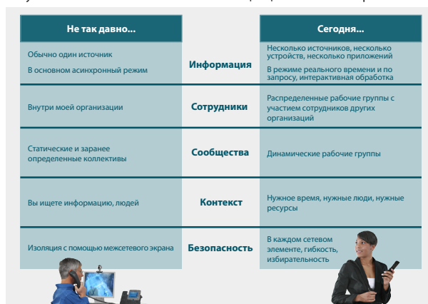
Рисунок 1. Пять основных элементов концепции совместной работы