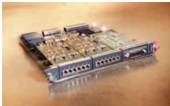
그림 1 Cisco Catalyst 6500 Series Communication Media Module

를 구축할 수 있으며, 각 데스크탑에서도 완벽하게 통합된 IP 통신을 구현할 수 있습니다. 컨버전스는 재래식 PBX가 아닌 IP 네트워크 인프라를 사용하여 음성을 지원합니다. 이것은 전체 인프라 투자 중에서 전화 사용료를 대폭 줄이고, 자본 및 운영 비용을 절감하며, 새로운 애플리케이션을 지원할 수 있어 업무 혁신을 위한 환경을 마련해 줍니다. (그림 2 참조)