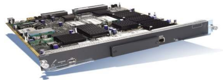
그림 1. Cisco 7600 SBC Module

Cisco 7600 SBC 솔루션은 Cisco Application Control Engine(ACE) 하드웨어의 고급 하드웨어 처리 성능을 통해 유연하고 확장 가능하며 기능이 풍부한 SBC를 구현합니다(그림 1).