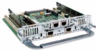
그림 1. 2포트 FXS VIC가 있는 NM-HDV2-2T1/E1

Cisco IP Communications 솔루션은 IP 텔레포니, 통합 서비스 및 톨 바이패스와 같은 서비스 혜택을 누릴 수 있도록 음성과 데이터의 통합한 솔루션입니다. 엔터프라이즈, 관리화된 네트워크 서비스 공급업체 및 서비스 공급업체가 이 솔루션을 통해 운영 비용을 절감하고 생산성을 향상시키는 등 IP 텔레포니의 혜택을 누릴 수 있습니다. 또한, Cisco IP Communications 솔루션을 통해 H.323, MGCP(Media Gateway Control Protocol)를 포함한 VoIP(Voice over IP)와 SIP(Sessions Initiation Protocol), VoF(Voice over Frame), 그리고 AAL2 및 AAL5 적응 레이어를 포함한 VoATM(Voice over ATM)을 비롯하여 여러 패킷 음성 기술을 사용할 수 있습니다.