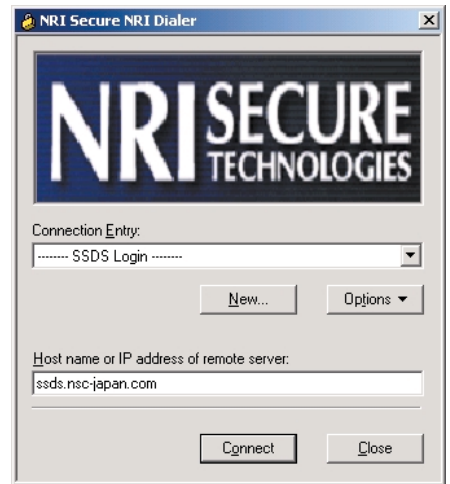
顧客用のログイン画面

実運用は始まったばかりだが、導入初期のトラブルもなく順調に切り換えが行えた。今後の展開についてNRIセキュアテクノロジーズはどのような構想を持っているのだろうか。その点について、