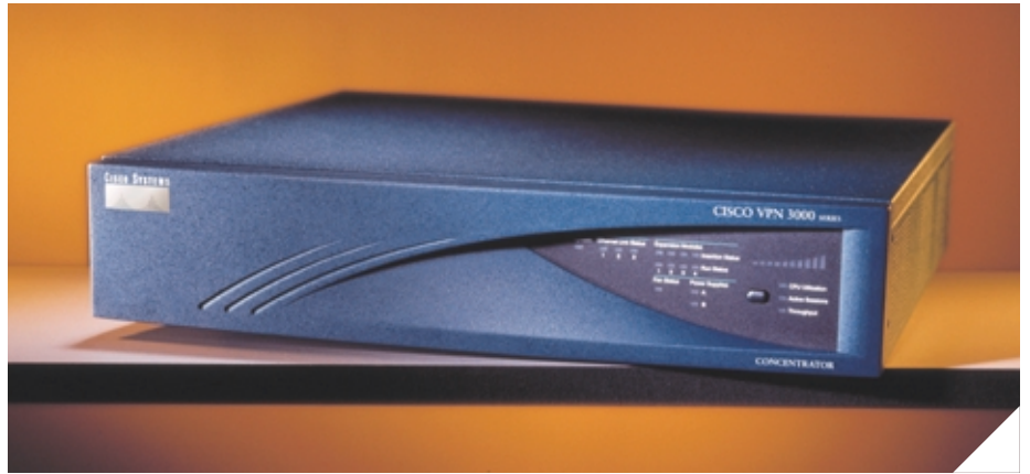
シスコのVPN3000コンセントレータがセキュリティサービスの中核を支える

めのVPNアクセスサービスを行うものです。今回、私が担当したのはイントラネットにアクセスするサービスの方になります。当社では顧客が社内からインターネットに対して接続するサービスを提供していて、その環境にVPNアクセスサービスを付け加えるような形で、外部からイントラネットに安全にアクセスできるサービスを別途提供しています。イントラネット用のシステムを組む時の機器に対して技術的に要求した部分としては、3つのポイントがありました。まず、外部からダイヤルアップで接続してくるユーザーを想定しているので、グローバルアドレスでアクセスしてきた時、そこをNATで変換する機能が必要となります。そして、当然のこととしてVPN機器が二重化対応できること。もう一つは、ダイヤルアップといってもケーブルテレビなどのユーザーもいらっしゃるため、ケーブルテレビからの接続に対応できることです。シスコの製品はこの3つを完全にクリアしていたため、採用することにまったく問題はありませんでした」