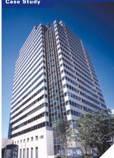
トータルなセキュリティ・ソリューションを顧客に提供するNRIセキュアテクノロジーズ株式会社