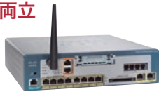
UC500 (8/16 ユーザ構成モデル)