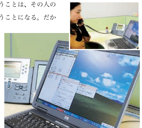
▲シスコ ユニファイド IP フォンと Microsoft Office Communicator 連携の利用イメージ

かけないために、個人宛のボイスメールを活用しましょう』という言い方をしていました。日本的な感覚に訴える内容で、上手だなと思いましたね」