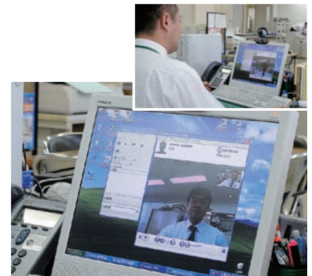
▲シスコ ユニファイド パーソナル コミュニケータの利用イメージ

電話システムについては、特に問題なく運用している。従来の電話内線網では、専用線で直接つながっていない事業部とのやり取りがスムーズに行えなかったことがあったが、そういった問題が解消された点は社内でも好評だという。また、従来は事業部によって交換機が異なっていたため、別々の業者による内線工事が必要だったが、導入後は不要になり、内線番号の運用管理も容易になった。