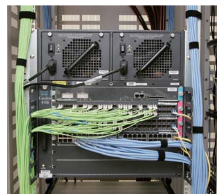
サーバールームに設置されたCisco Catalyst 4506。

2つめが、電話会議で迅速な事務連絡が実現したことである。職員も両キャンパスに分散してお