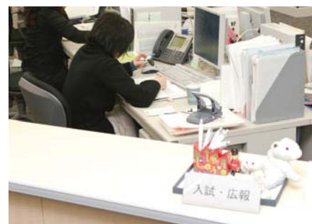
職員室の各座席に置かれたCisco IP Phone (上)。Cisco IP phoneを使用している職員 (中)。1F受付に設置されたCisco IP Phone (下)。