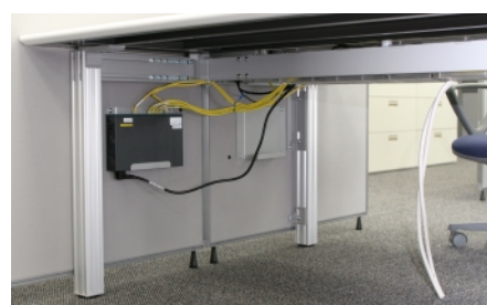
新本社のマシンルームに設置されたCatalyst6513 ×2、Catalyst4506 ×2、Cisco7204VXR ×2(上)、各島の下にマグネットで取り付けられているCatalyst2940(下)