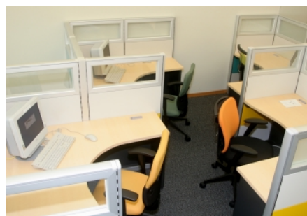
立ち寄った人が誰でも必要ときに業務を開始できる、ドロップインオフィス。