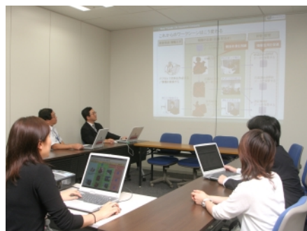
無線LANにより、会議室に必要な資料をその場で参照可能。

まず第1は、当初の目的でもあった“ワークスタイルの変革”に貢献していることだ。無線LANがオフィスエリア全体をカバーすることで、ユーザーは自席だけではなく、会議室でもノートPCを利用できるようになった。このため会議に必要な資料をその場でサーバーから取り出したり、会議の議事録をその場で作成して発信するといったことが可能になったのである。「必要かどうか分からない資料を念のために用意するといった無駄な作業や、急に必要になった資料を自席まで取りに戻るといった手間も削減できます」と野賀氏。これは会議の効率化はもちろんのこと、日常業務の効率向上にも大きな貢献を果たしているという。