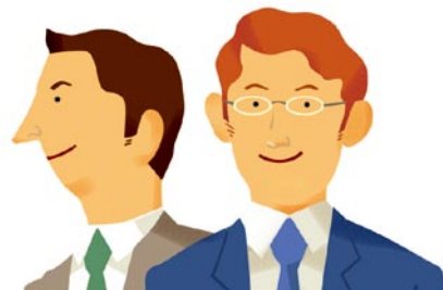
AM (営業)/SE ※1 名でも可