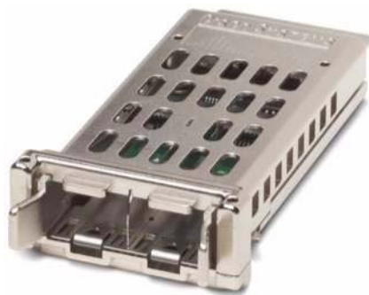
図 1 Cisco TwinGig コンバータ モジュール

Cisco TwinGig SFP コンバータ (図 2) は、10 ギガビット イーサネット X2 インターフェイスを 2 つのギガビット イーサネット SFP (Small Form-Factor Pluggable) ポートに変換します。Cisco TwinGig SFP によって、最初はギガビット イーサネット アップリング (図 3) でスイッチを使用している場合、ビジネス ニーズの変化に応じて、アクセス レイヤをアップグレードすることなく 10 ギガビット イーサネット アップリンクを実装できます。