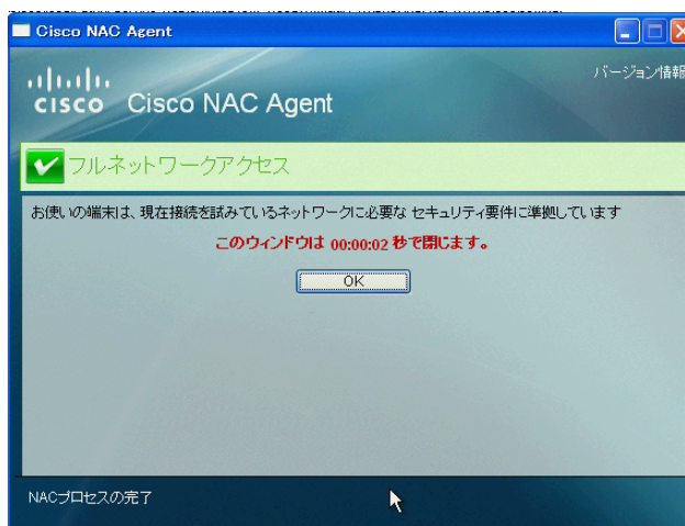
図 3 リリース 4.6.1 の Cisco NAC エージェントではマルチバイトキャラクタをサポート

4.6.1 リリースに含まれる新しい Cisco NAC エージェントは、マルチバイト キャラクタ セット (MBCS) をサポートし、エージェント ログイン、状態確認、および修復画面のダイアログやメッセージが日本語で表示されます。