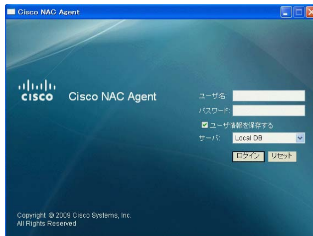
図 1 Windows ベースの Cisco NAC エージェント

新しいエージェントでは、ユーザ認証のほかにも、64 ビット Windows OS での状態確認（ポスチャアセスメント）と修復機能をサポートしています。また、新しいログパッケージャユーティリティ（Log Packager Utility）によって PC から診断情報を収集することができるため、トラブルシューティングが簡素化されます。