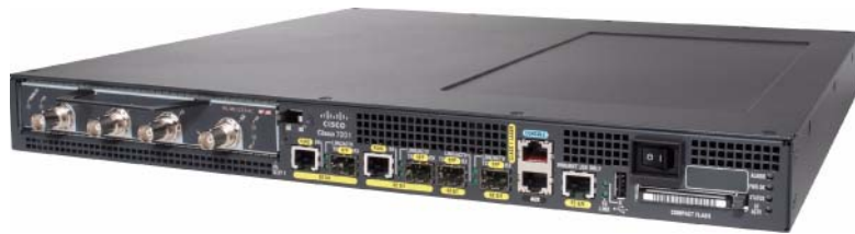
図 1 Cisco 7201 ルータ

Cisco 7201 ルータは、処理能力の向上と、最新の Cisco IOS ソフトウェア機能の実装によって、パフォーマンスと柔軟性の要求に対応します。