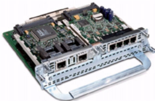
図 1 : VWIC-2MFT と VIC-4FXS/DID を 搭載した NM-HD-2VE

Cisco 2600XM シリーズ、Cisco 2691、Cisco 3600、および 3700 シリーズ 音声ゲートウェイルータ用 Cisco IP コミュニケーション音声 / ファックス ネットワーク モジュールにより、VoIP (H.323、Media Gateway Control Protocol [MGCP; メディアゲートウェイコントロールプロトコル]、および Session Initiation Protocol [SIP])、Voice over Frame Relay、Voice over ATM (ATM アダプテーションレイヤ 2[AAL2] および AAL5) などのパケット音声テクノロジーを利用できるようになります。Cisco IP コミュニケーション ソリューションにより、1 つのネットワーク上で音声とデータを統合できるため、IP テレフォニー、統合サービス、トールバイパスなどのサービスが利用可能になると同時に、生産性を向上する機会が生まれます。これらのソリューションを Cisco IOS ソフトウェア上で運用することにより、先進の Quality of Service (QoS) 機能、