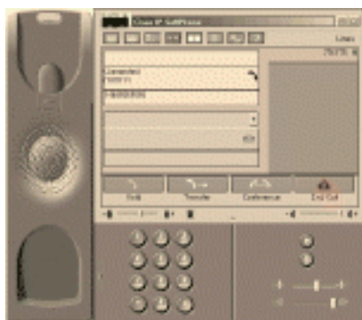
図 1 : Cisco IP SoftPhone

IP ベースのソリューションの要求される環境に導入する製品として、豊富な機能を備えた Cisco IP SoftPhone は、当然選ばれる選択肢になっています。VPN (Virtual Private Networks) の使用により、出張中も任意のインターネット接続を利用して、オフィスにいるときと同じように電話を使うことができます。パーソナルコンピュータと VoIP を統合し、PSTN (公衆電話網) も相互に利用したいと考えているユーザーは、Cisco IP Phone を選択するはずですが、