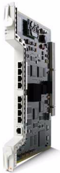
図 1 Cisco ONS 15454 CE シリーズ 8 ポート 10/100BASE-T イーサネット カード

Cisco ONS 15454 MSPP は、オプティカル業界初のメトロ オプティカル トランスポート プラットフォームです。Cisco ONS 15454 は、高密度な SONET/SDH 伝送、統合型オプティカル ネットワーキング (ITU グリッド 波長、Dense Wavelength-Division Multiplexing [DWDM; 高密度波長分割多重] など)、および先進的なオンデマンド マルチサービス インターフェイス (TDM、イーサネット /IP、ストレージなど) を兼ね備え、大幅な経済的利益をもたらします。Cisco ONS 15454 は、1つのプラットフォームで複数のネットワーク エlementとして機能します。シスコシステムズの高度なエンドツーエンド サービス アーキテクチャの重要なコンポーネントである Cisco ONS 15454 は、次世代の音声およびデータ サービスをコスト効率よく提供するために必要となる、スケーラブルなオプティカル トランスポート メカニズムおよびインテリジェントなイーサネット /IP をサポートします。