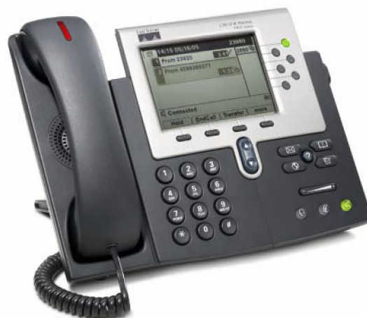
Figure 1. Le téléphone IP Cisco Unified 7961G-GE

Capable de fournir une bande passante illimitée à vos applications de bureau, le téléphone IP Cisco Unified 7961G-GE est équipé des plus récentes technologies et des derniers progrès en matière de téléphonie VoIP Gigabit Ethernet. Avec son port Gigabit Ethernet pour une intégration avec un PC ou un serveur de bureau (Figure 1), il permet à vos utilisateurs d'accéder rapidement aux données et aux applications du réseau. Disposant de fonctions identiques à celles du Cisco 7961G, ce téléphone IP Gigabit Ethernet amélioré pour cadres et dirigeants d'entreprise présente six boutons rétroéclairés programmables pour des lignes ou des fonctions et quatre touches interactives programmables qui guident l'utilisateur à travers les diverses caractéristiques et fonctions de l'appel. Il offre aussi des réglages audio pour les hauts parleurs duplex de haute qualité, le combiné et le casque. Son grand écran LCD de grande résolution à échelle de gris permet d'accéder facilement aux informations de communication, aux applications optimisées et aux diverses fonctionnalités de l'appareil (Figure 2). Il donne également aux utilisateurs et aux développeurs la possibilité d'installer à l'écran davantage d'applications innovantes et productives en langage XML (Extensible Markup Language) et peut afficher à l'écran des langues à « double octet ».