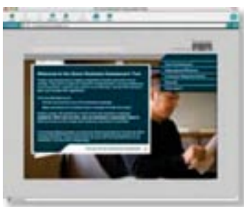
Cisco Smart Business Assessment -arviointityökalu