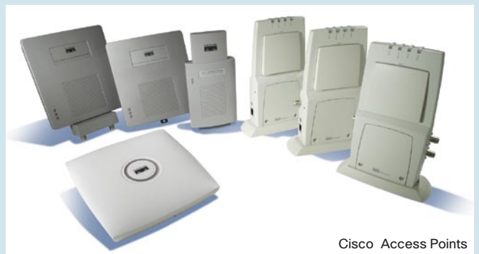
Cisco Access Points

Die Cisco Access Points 1130AG, 1230AG und 1240AG sind Dual-Band-fähig und unterstützen somit alle gängigen Standards wie 802.11a/b/g sowie WMM und die Sicherheitsstandards 802.11i und WPA2 (siehe Kasten Begriffe). Der Access Point 1240AG hat ein stabiles Metallgehäuse und eine Montagevorrichtung und eignet sich daher auch für raue Betriebsumgebungen, etwa in Fabriken, Lagern und Einzelhandelsbetrieben. Er kann bei Temperaturen zwischen -20 und 55 Grad Celsius eingesetzt werden. Die Stromversorgung erfolgt entweder lokal oder über Power-over-Ethernet.