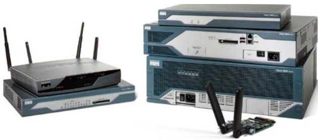
Cisco Integrated Services Router