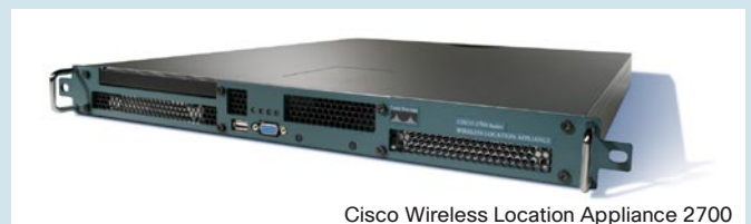
Cisco Wireless Location Appliance 2700

Auf großen Firmengeländen, beispielsweise in Lagern, ist die Lokalisierung von einzelnen Produkten, Fahrzeugen oder auch Access Points eine ständige Herausforderung. Alle Wireless-LAN Clients oder mit RFID-Tags (RFID = Radio Frequency Identification) ausgestattete Gegenstände können mithilfe der Cisco Wireless Location Appliance 2700 auf einem Lageplan sichtbar und damit ausfindig gemacht werden.