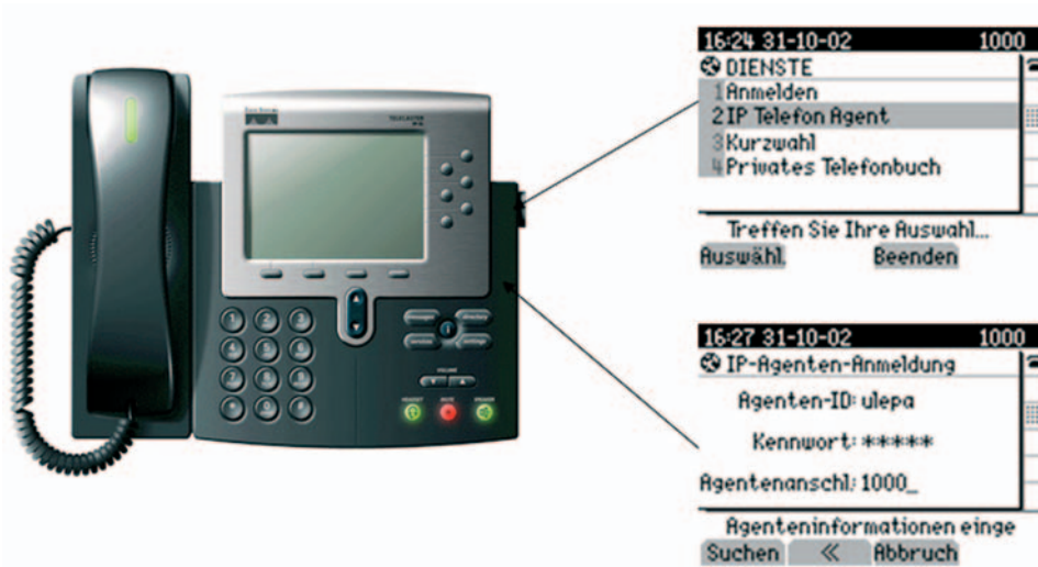
Abbildung 2: Cisco Unified IP Phone Agent