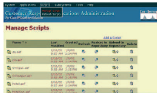
Abbildung 4: Web-basierende Administration

Cisco Unified Contact Center Express Standard bietet Administration auf Web-Basis, die voll in die von Cisco Unified CallManager integriert ist. Die Administration kann von jeder Stelle im Unternehmens-WAN aus erfolgen (Abbildung 4).