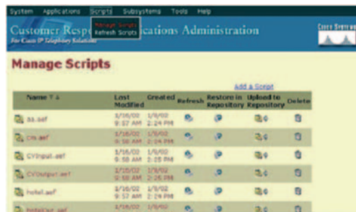
Abbildung 5: Web-basierende Administration

Cisco Unified Contact Center Express Premium bietet Administration auf Web-Basis, die voll in die von Cisco Unified CallManager integriert ist. Die Administration kann von jeder Stelle im Unternehmens-WAN aus erfolgen (Abbildung 5).