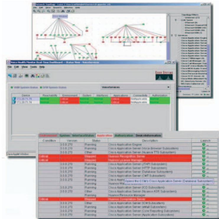
Abbildung 6: Unterstützung von Cisco Unified Contact Center Express Premium durch CiscoWorks