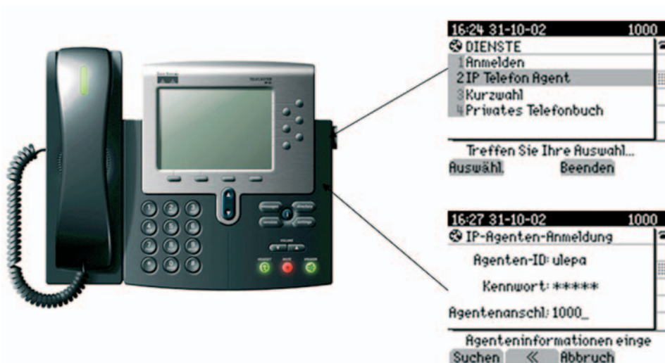
Abbildung 3: Cisco Unified IP Phone Agent