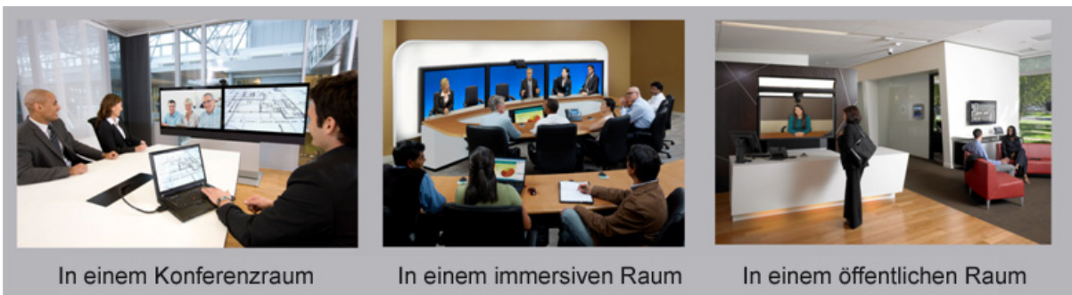
In einem Konferenzraum