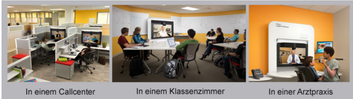
In einem Callcenter