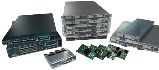
图 1: Cisco Unified Computing System 包括交换矩阵互联、交换矩阵扩展器、刀片服务器机箱、刀片服务器、网络适配器和内存扩展技术（未显示）

无论只有 1 个服务器还是有 320 个服务器以及数千个虚拟机，Cisco Unified Computing System 都会将其作为一个系统进行管理，从而降低了扩展的复杂性。Cisco Unified Computing System 通过对虚拟化和非虚拟化系统提供端到端调配和迁移支持，能够简便、可靠、安全地加快新服务的交付速度。