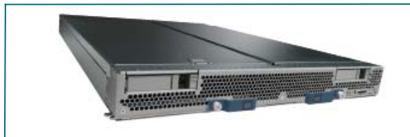
图1: Cisco UCS B-250 M1扩展内存刀片服务器

Cisco UCS B-250 M1采用了思科荣获专利的扩展内存技术。该项思科技术提供的工业标准内存（384GB）是传统双路服务器的两倍多，其性能和容量都进行了提高，适用于要求严格的虚拟化和大型数据集工作负载（图2）。此外，该项技术还为要求较低的工作负载提供了更为经济高效的内存配置方式。