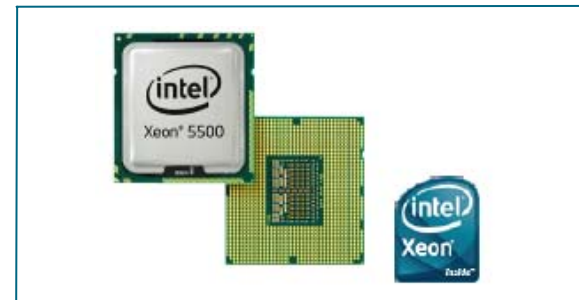
图3: Intel Xeon 5500系列处理器

每个Cisco UCS B-250 M1使用网络适配器来整合对统一阵列的访问。这种设计减少了LAN和SAN连接所需的适配器、线缆和接入层交换机数量。借助这一思科创新，能够大幅降低投资和运营开支，包括管理开销、电源和冷却成本。可选的网络适配器（图4）包括专为虚拟化、兼容性和高性能以太网而优化的多种适配器。