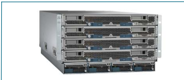
图5: 安装在Cisco UCS 5108刀片服务器机箱中的Cisco UCS B-250 M1刀片服务器

Cisco UCS 5108刀片服务器机箱能采用1到4个效率高达92%的2500W热插拔电源，它们可配置为非冗余、N+1冗余或全冗余设计。机箱电源的设计提供了足够的功率储备，能够支持未来每个处理器功率都高达130W的刀片服务器。