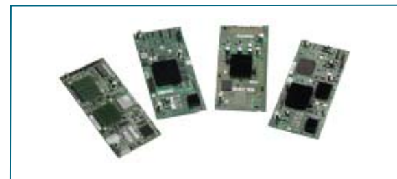
图4: Cisco UCS网络适配器

每个Cisco UCS B-250 M1使用网络适配器来整合对统一阵列的访问。这种设计减少了LAN和SAN连接所需的适配器、线缆和接入层交换机数量。借助这一思科创新，能够大幅降低投资和运营开支，包括管理开销、电源和冷却成本。可选的网络适配器（图4）包括专为虚拟化、兼容性和高性能以太网而优化的多种适配器。