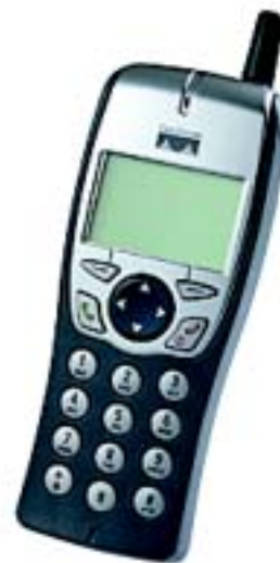
图 1 思科无线 IP 电话 7920

思科无线 IP 电话 7920 为思科的 IP 通信解决方案提供了第一代无线 IP 电话。思科无线 IP 电话 7920 支持多种呼叫特性和有助于改善语音质量的功能。