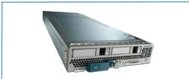
图1: Cisco UCS B-200 M1刀片服务器

Cisco UCS B-200 M1旨在提高性能、能效和灵活性，更好地满足多种虚拟和非虚拟应用的要求。Cisco UCS B系列刀片服务器采用Intel Xeon 5500系列处理器（参见图2），能够根据应用需要，调整处理器性能，并根据使用率，智能地降低能耗。