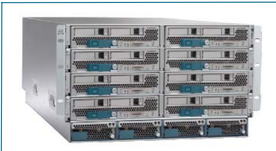
图4: 安装在Cisco UCS 5108刀片服务器机箱中的Cisco UCS B-200 M1刀片服务器

Cisco UCS 5108刀片服务器机箱能采用1到4个效率高达92%的2500W热插拔电源, 它们可配置为非冗余、N+1冗余或全冗余设计。机箱电源的设计提供了足够的功率储备, 能够支持未来每个处理器功率都高达130W的刀片服务器。