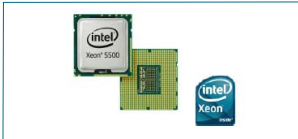
图2: Intel Xeon 5500系列处理器

每个Cisco UCS B-200 M1使用网络适配器来整合对统一阵列的访问。这种设计减少了LAN和SAN连接所需的适配器、线缆和接入层交换机数量。借助这一思科创新，能够大幅降低投资和运营开支，包括管理开销、电源和冷却成本。可选的网络适配器（参见图3）包括专为虚拟化、兼容性和高性能以太网而优化的多种适配器。