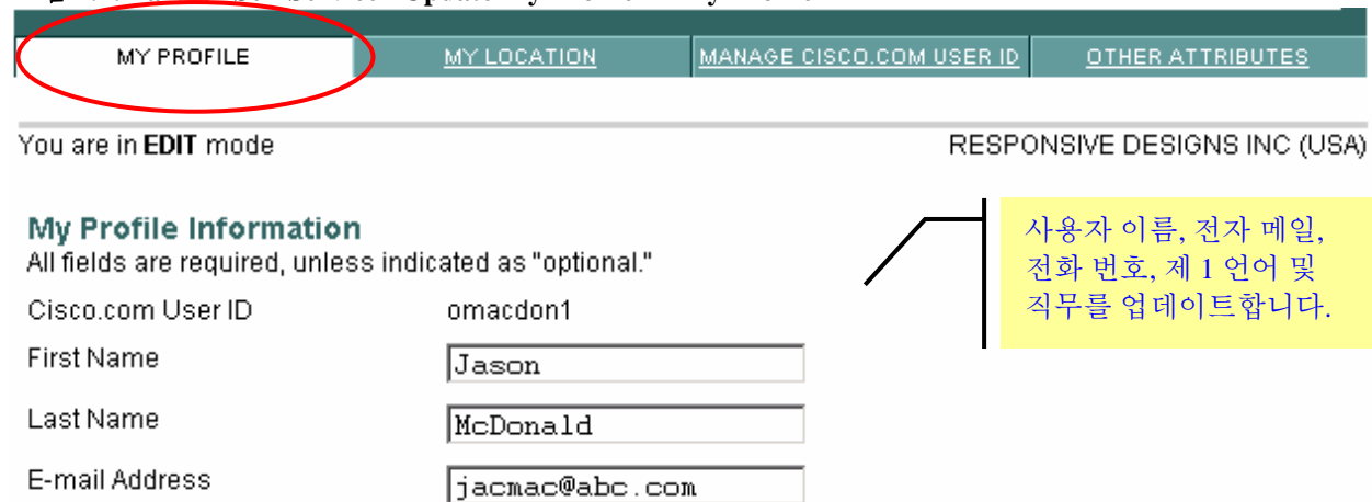
그림 2.2: Partner Self Service "Update My Profile" – My Profile

전자 메일 주소, 전화 번호, 사용자 ID 와 같은 개별 파트너 프로필 정보를 편집하려면 Partner Self Service 홈 페이지에서 “Update My Profile”을 클릭합니다.