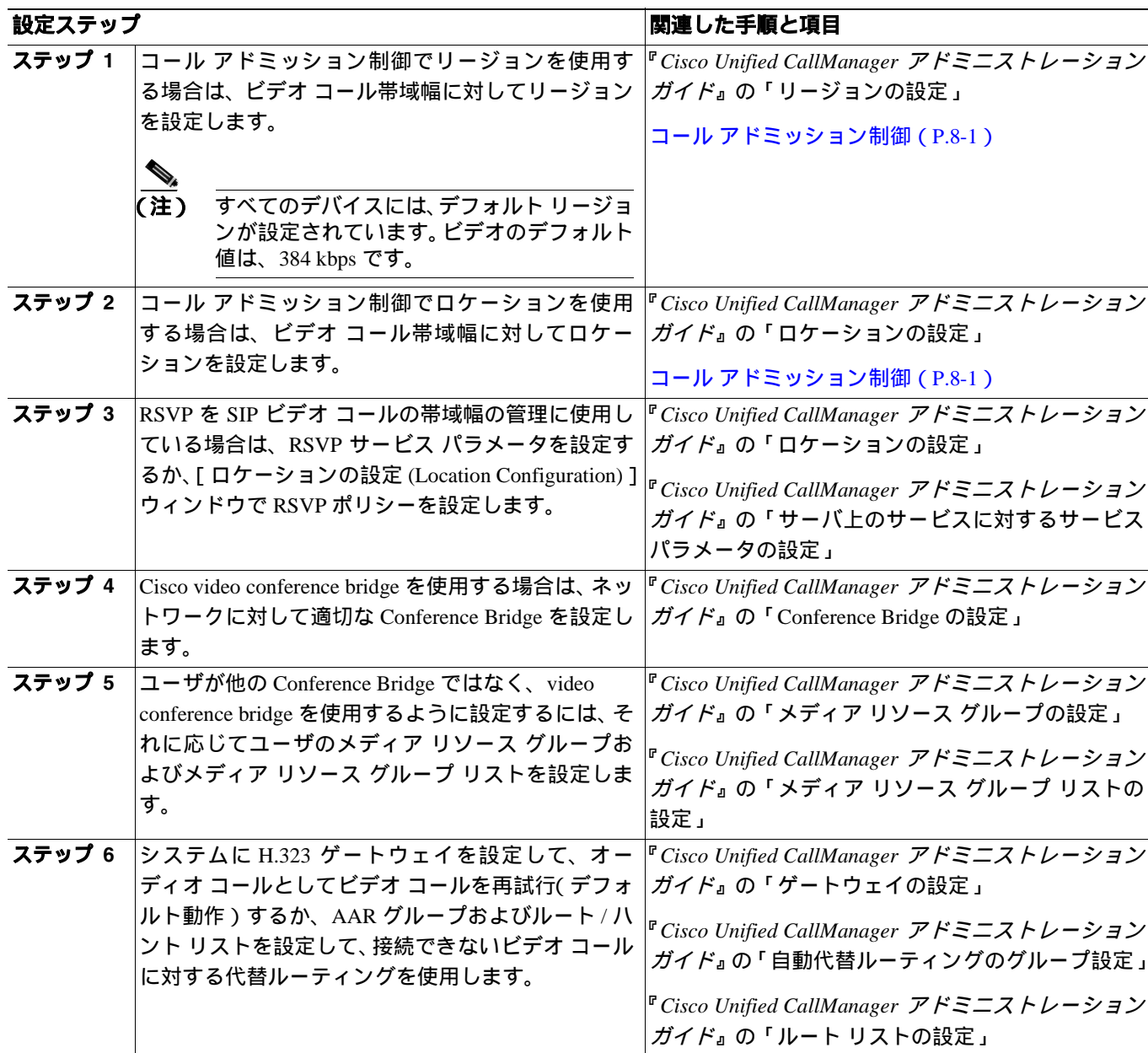
表 44-1 ビデオテレフォニー設定チェックリスト

表 44-1 に、Cisco Unified CallManager の管理ページでビデオテレフォニーを設定するためのチェックリストを示します。