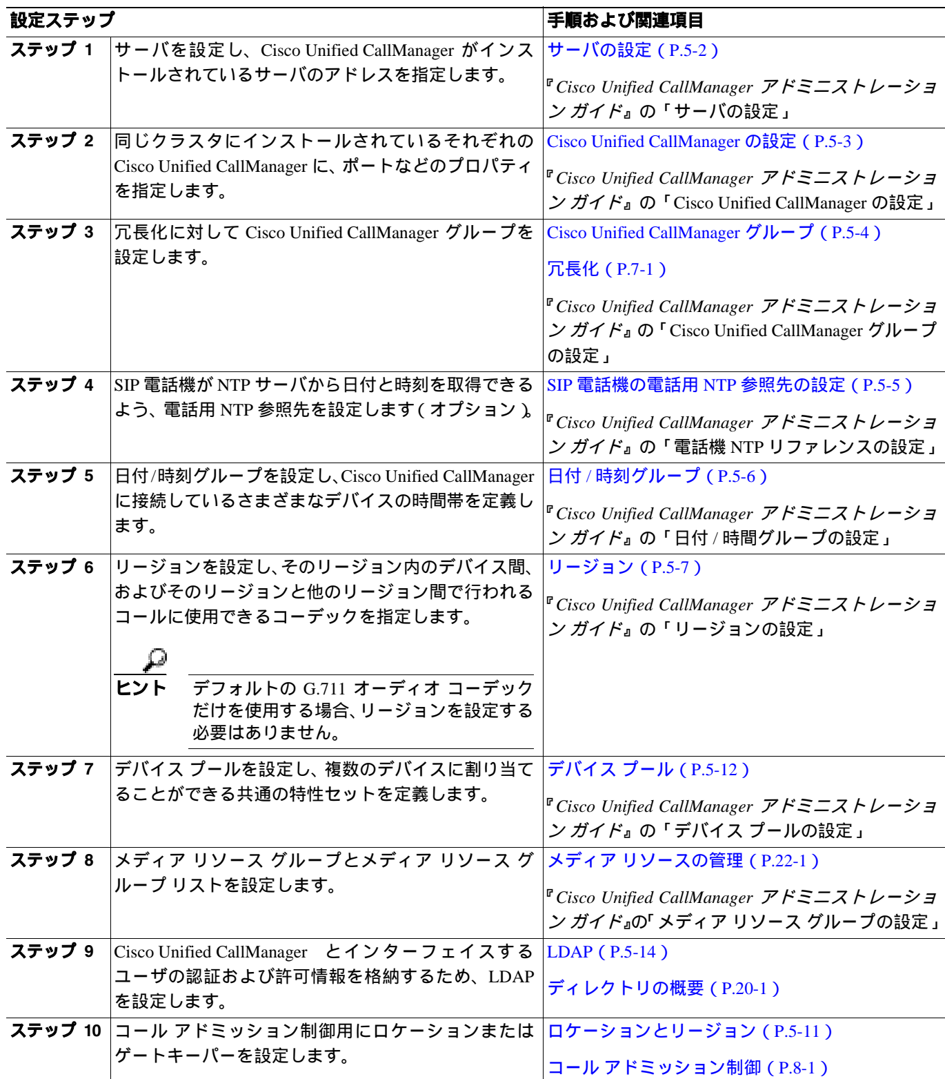
表 5-2 システム設定チェックリスト

表 5-2 は、システム レベルの設定値を設定するための一般的な手順を示しています。