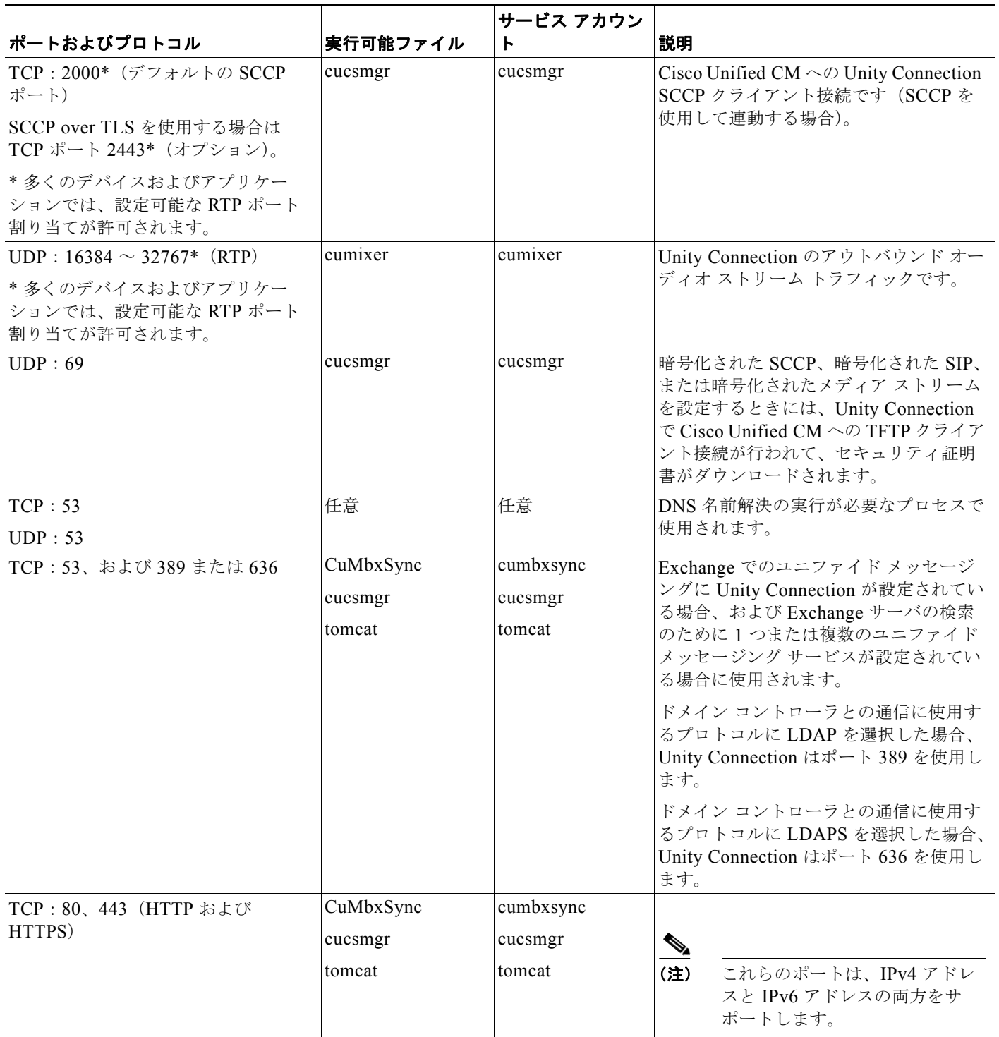
表 1-2 ネットワーク内の他のサーバとの接続のために Cisco Unity Connection によって使用される TCP ポートおよび UDP ポート