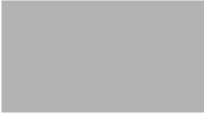
図 23-1 メトロポリタンイーサネット ネットワークにおける DHCP リレー エージェント

スイッチで DHCP スヌーピング情報オプション Option 82 をイネーブルにすると、次のイベントがこの順序で発生します。