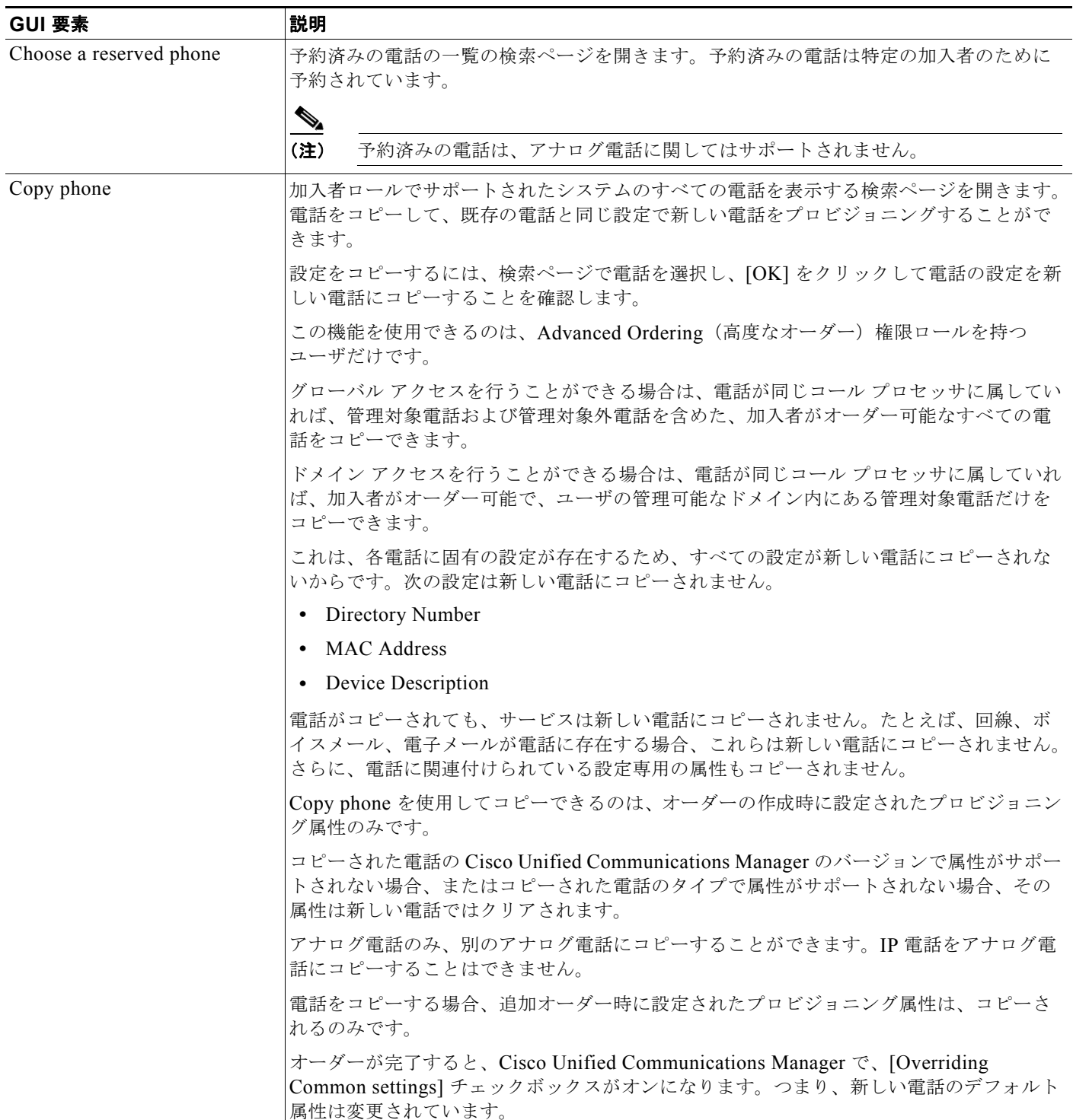
表 8-3 [Order Entry] のフィールド (続き)