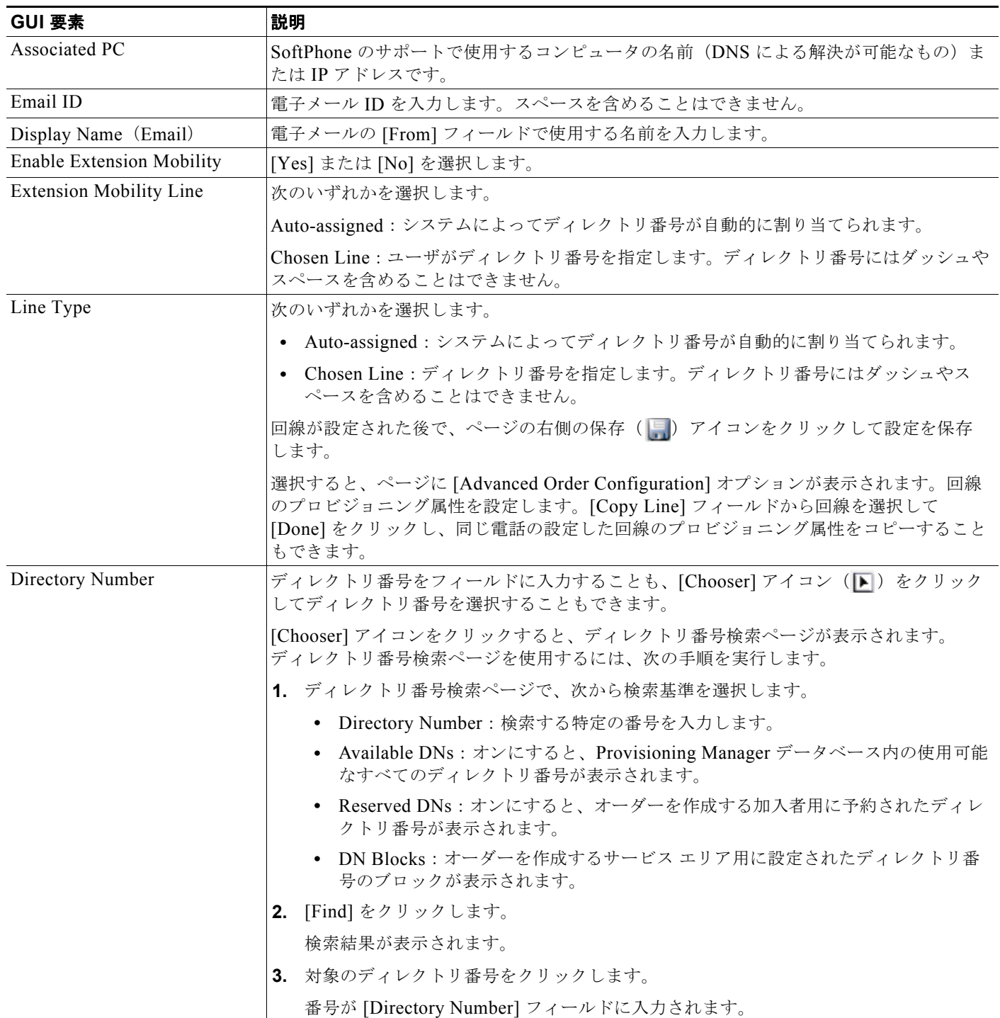
表 8-3 [Order Entry] のフィールド