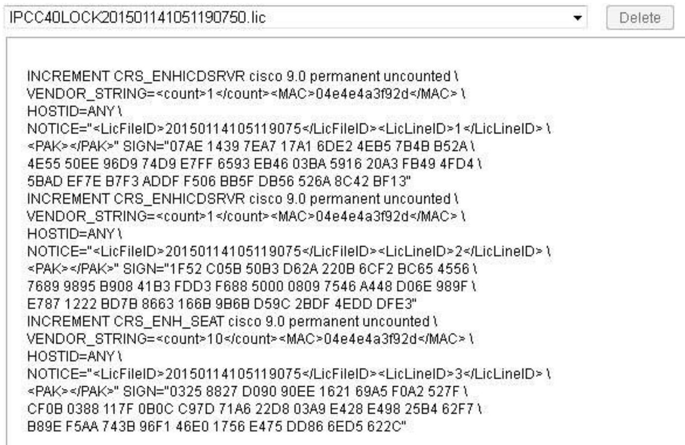
Figura 3: Índices da licença

Quando você vê a informação de licença, é boa prática verificar que os recursos chaves estão corretos. Estão aqui alguns recursos principais que você deve verificar em um arquivo de licença: