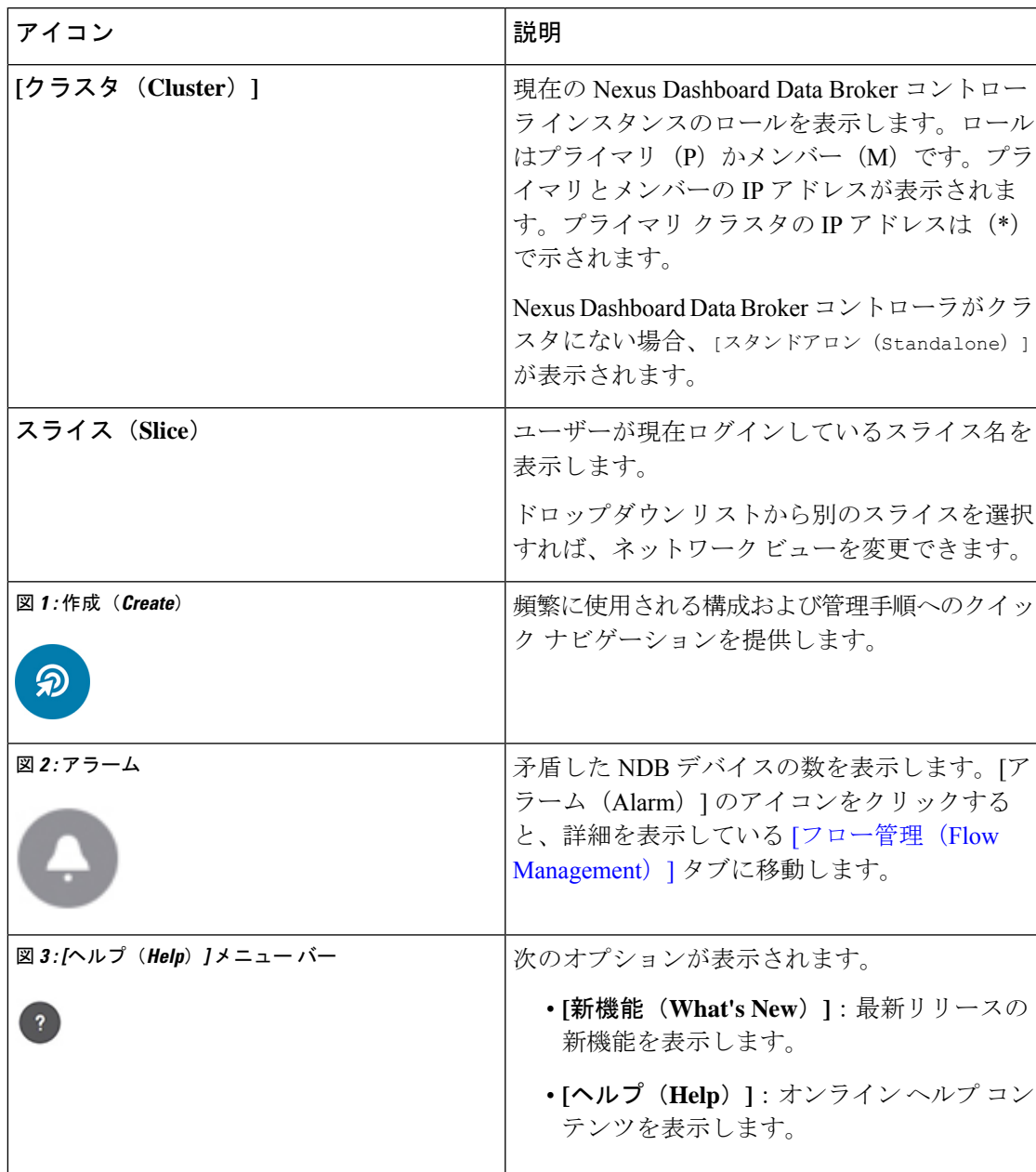
表 2: Cisco Nexus Dashboard Data Broker ヘッダー アイコン