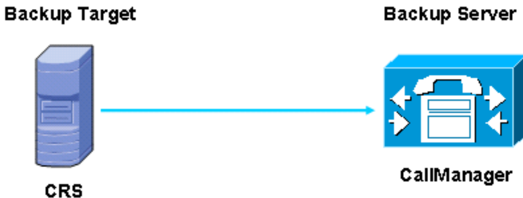
図 1?A 簡単なセットアップ-バックアップサーバ ( CallManager ) およびバックアップ ターゲット ( CRS )

図 1 トポロジを示します。バックアップサーバは CallManager であり、バックアップ ターゲットは CRS サーバです。