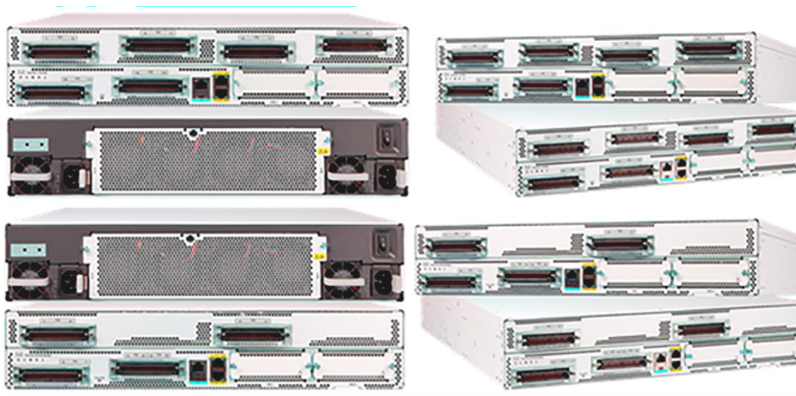
図 1. Cisco VG410 Medium-Density Analog Voice Gateway シリーズ

音声と IP コミュニケーションの製品およびアプリケーションで構成される Cisco® Unified Communications ポートフォリオは、より効果的なコミュニケーションを促進し、ビジネス プロセスの合理化、適切なリソースの迅速な活用、営業収益と利益性の改善に役立ちます。Cisco Unified Communications ポートフォリオは、シスコ ビジネス コミュニケーション ソリューションの重要な一部です。このソリューションは、あらゆる規模の組織に対応する統合ソリューションであり、ネットワーク インフラストラクチャ、セキュリティ、ネットワーク管理の各製品、ワイヤレス接続、ライフサイクル サービス アプローチのほか、柔軟な導入およびアウトソース管理オプション、エンドユーザーおよびパートナー向け融資パッケージ、サードパーティ製通信アプリケーションなどで構成されています。