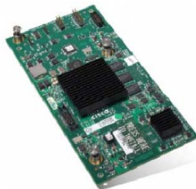
図 1 Cisco UCS M81KR 仮想インターフェイス カード

シスコの技術革新から生まれた Cisco UCS M81KR 仮想インターフェイス カード(VIC)は、仮想化のために最適化された Fibre Channel over Ethernet (FCoE)メザニン カードです。このカードは、Cisco UCS B シリーズ ブレード サーバと共に使用できるよう設計されています(図 1)。この VIC はデュアルポートの 10 ギガビット イーサネット メザニン カードで、これ 1 枚で PCIe (Peripheral Component Interconnect Express) 準拠の仮想インターフェイスが最大 128 個サポートされます。仮想インターフェイスは動的に構成することができ、インターフェイスのタイプ、つまりネットワーク インターフェイス カード(NIC)またはホスト バス アダプタ(HBA)と、アイデンティティ、つまり MAC アドレスと WWN(Worldwide Name)の両方を、ジャストインタイム プロビジョニングを使用して設定することが可能です。さらに、Cisco UCS M81K は、ネットワークにサーバ仮想化インテリジェンスを加える Cisco VN-Link テクノロジーもサポートしています。