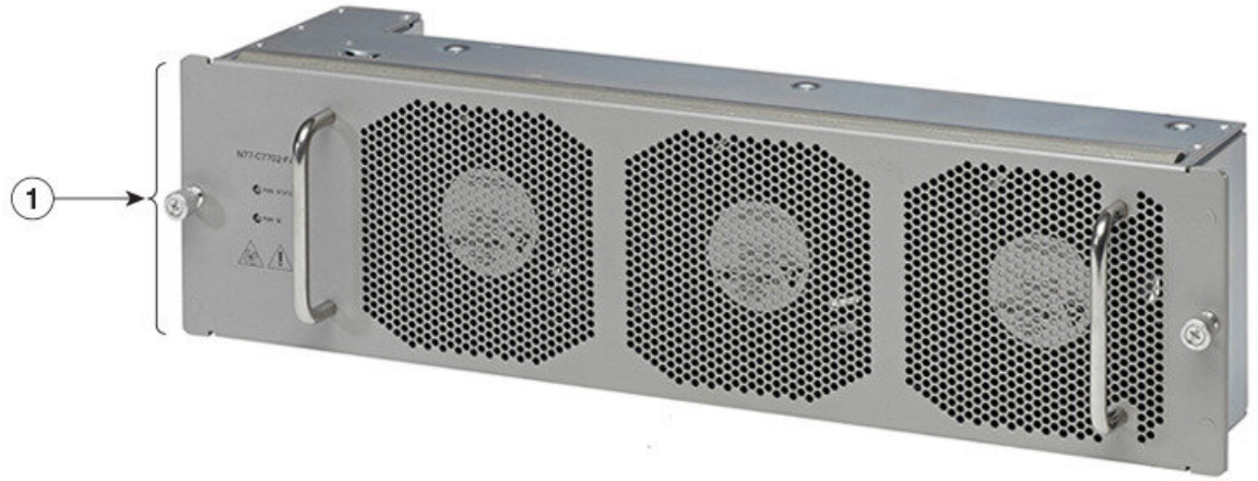
Figura 2: Características de hardware estándar en la parte posterior del chasis Cisco Nexus 7702