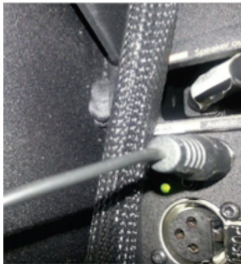
DNAM LED w/ green power light