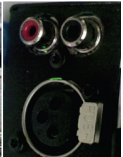
DNAM no LED w/ reflected green light

Nota: El codificador-decodificador detecta solamente el DNAM sobre el lanzamiento, así que usted debe recomenzar siempre el codificador-decodificador de centro después de que usted resuelva problemas el DNAMs.