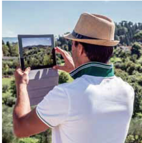
Новые способы доступа к государственным услугам, особенно в сельской местности