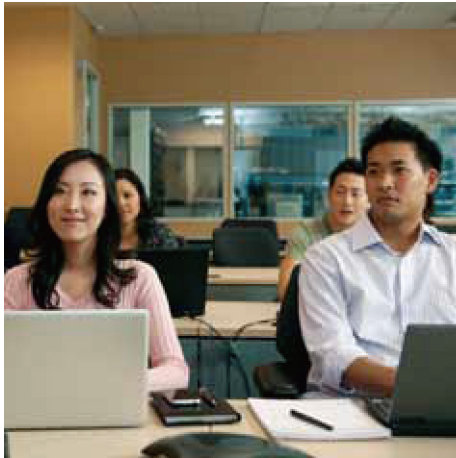
Трехлетнее обучение для 200 000 человек по специальностям, связанным с цифровыми сетевыми технологиями