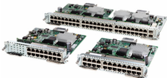
图 1. Cisco Enhanced EtherSwitch Service Modules

Cisco Enhanced EtherSwitch Service Modules (图 1) 综合了行业领先的第 2 层和第 3 层交换与 Cisco Catalyst® 3560-E 和 Catalyst 2960 系列交换机所采用的相同功能集，大大扩展了路由器的功力。全新 Cisco Enhanced EtherSwitch Service Modules 是首批采用 Cisco 3900 和 2900 系列集成多业务路由器增强功能的模块。此外，这些服务模块还支持思科行业领先的电源提议、思科 EnergyWise®、思科增强型以太网供电 (Cisco Enhanced Power over Ethernet, ePoE) 以及按端口监控以太网供电电源—所有这些都大大增强了分支机构满足下一代需求的扩展能力，并且仍然满足 IT 团队运行高能效网络的重要计划。而且，Cisco Enhanced EtherSwitch Service Modules 不仅可以执行本地线速交换和路由，还通过第 2 代集成多业务路由器多千兆光纤 (MGF) 将局域网流量与广域网资源分离，从而支持直接服务模块到服务模块的通信。