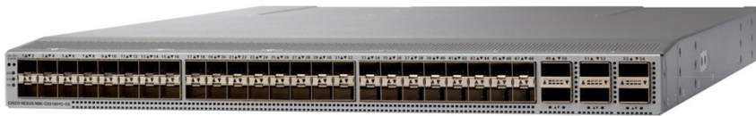
图 1. Cisco Nexus 93180YC-EX 交换机

Cisco Nexus 93108TC-EX 交换机（图 2）是一款 1RU 交换机，支持 2.16 Tbps 带宽，吞吐量超过 1.7 bpps。93108TC-EX 的 48 个 10GBASE-T 下行链路端口可配置为 100 Mbps、1 Gbps 或 10 Gbps 端口。上行链路可以支持最多 6 个 40 Gbps 和 100 Gbps 端口，或 10、25、40、50 和 100 Gbps 的连接组合，提供灵活的迁移选项。