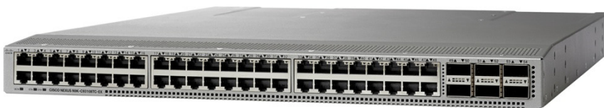
图 2. Cisco Nexus 93108TC-EX 交换机

Cisco Nexus 93108TC-EX 交换机（图 2）是一款 1RU 交换机，支持 2.16 Tbps 带宽，吞吐量超过 1.7 bpps。93108TC-EX 的 48 个 10GBASE-T 下行链路端口可配置为 100 Mbps、1 Gbps 或 10 Gbps 端口。上行链路可以支持最多 6 个 40 Gbps 和 100 Gbps 端口，或 10、25、40、50 和 100 Gbps 的连接组合，提供灵活的迁移选项。