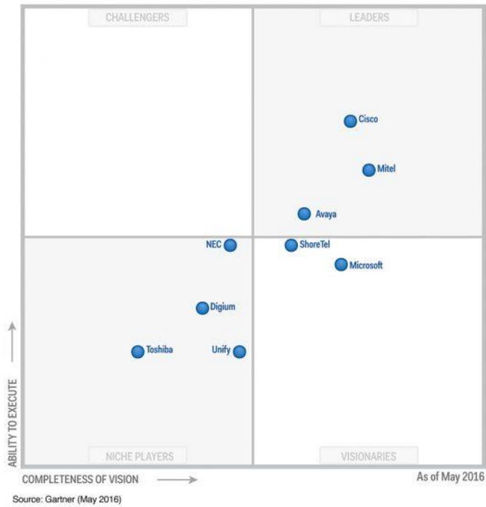
Magic Quadrant for Unified Communications for Midsize Enterprises, North America