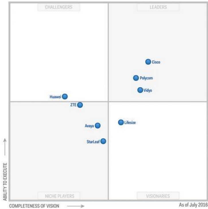
Magic Quadrant for Group Video Systems