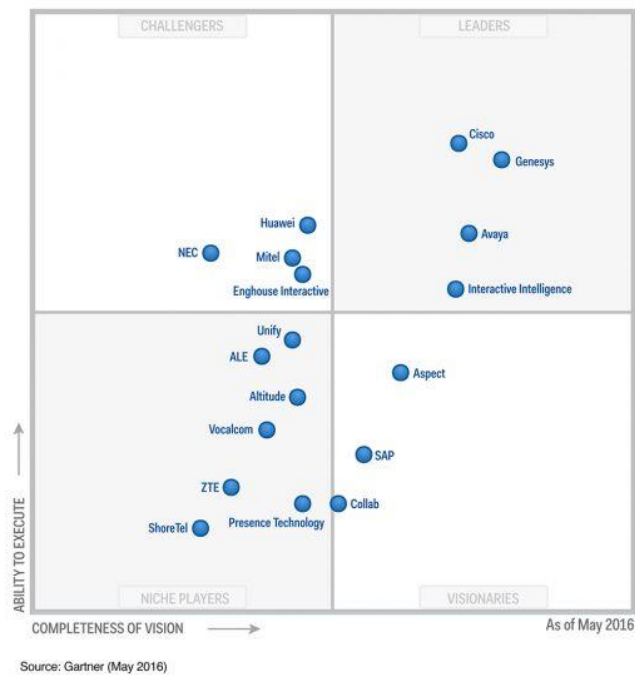
Magic Quadrant for Contact Center Infrastructure, Worldwide

Gartner 连续第五年在它的联系中心基础设施魔力象限报告中将 Cisco 评为具有最大的“执行力”。我们相信，我们无与伦比的全球合作伙伴网络，以及我们在为所有企业简化客户服务的部署和管理方面的努力，是我们持续成功的原因。