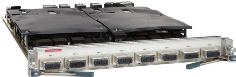
그림 1. Cisco Nexus 7000 Series 8포트 10기가비트 이더넷 모듈(XL 옵션)

Cisco Nexus 7000 시리즈 스위치는 확장성이 뛰어난 10기가비트 이더넷 네트워크용으로 설계된 모듈형 데이터 센터급 제품 라인으로 시스템 용량이 초당 15테라비트(Tbps)를 초과하는 패브릭 아키텍처를 포함하며, 향후 40 및 100기가비트 이더넷 인터페이스에 대한 지원을 제공합니다. 또한, 가장 미션 크리티컬한 데이터 센터의 요구사항에 충족하기 위해 지속적인 시스템 운영과 가상화된 퍼베이시브 서비스를 제공합니다. 관리 기능 및 서비스 편의성이 뛰어난 Cisco Nexus 7000 Series는 서비스를 중단하지 않고도 실시간 시스템 업그레이드를 할 수 있는 고급 기능을 갖춘 검증된 Cisco NX-OS 운영 체제를 사용합니다. 이 혁신적인 통합 패브릭 설계는 특별히 단일 무손실 이더넷 패브릭에 IP, 스토리지 및 프로세스간 커뮤니케이션 네트워크의 통합을 지원하기 위한 설계입니다.