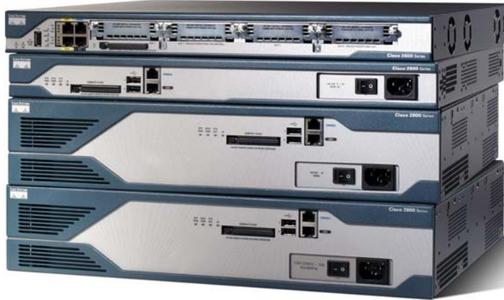
그림 1 Cisco 2800 Series

시스코 시스템즈®는 새로운 계열의 Integrated Services Routers를 통해 최고 수준의 엔터프라이즈 및 중소 규모 비즈니스 라우팅을 재정의하고 있습니다. 이러한 Integrated Services Routers는 동시에 발생하는 데이터, 음성 및 비디오 서비스를 안전한 회선 속도로 전달하도록 최적화되어 있습니다. 20년 간의 주도권과 혁신을 바탕으로 개발된 모듈형 Cisco® 2800 Series Integrated Services Routers는 중요한 비즈니스 애플리케이션을 빠르고 정확하게 제공하기 위해 데이터와 보안을 복원성이 뛰어난 단일 시스템에 인텔리전트하게 포함시킵니다. Cisco 2800 Series의 고유한 통합 시스템 아키텍처는 비즈니스의 민첩성과 투자 보호를 극대화합니다.